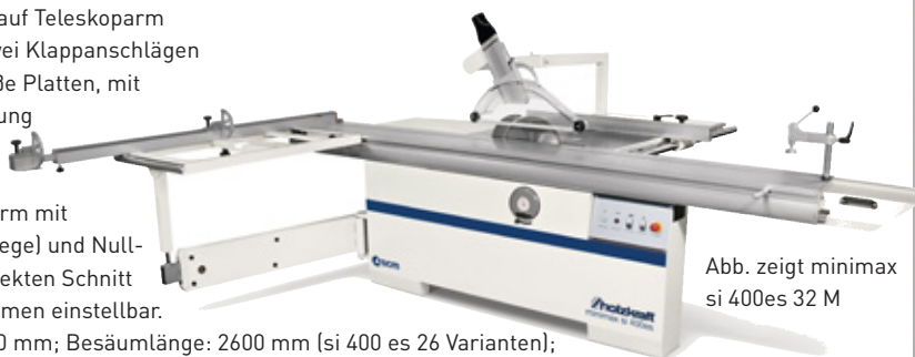
Abb. zeigt minimax si 400es 32 M

Technische Daten: Tischabmessungen: 940 x 560 mm; Besäumlänge: 2600 mm (si 400 es 26 Varianten); 3200 mm (si 400 es 32 Varianten) max. Schnitthöhe: 90°/45° mit Vorritz: 138 / 98 mm; Schnittbreite mit Parallelanschlag: 1270 mm; Sägeblattneigung: 90°-45°; max. Sägeblatt-Ø mit Vorritz: Ø 400 mm; Motorleistung 400 V: 7,0 kW